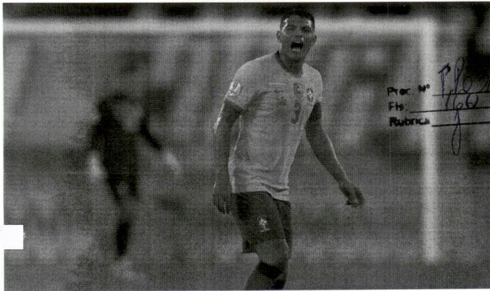
Thiago Silva, capitão da seleção brasileira, durante jogo da Copa América